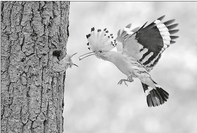
Wiedehopf Upupa epops

Der auffällige Wiedehopf ist unverwechselbar. Mit seinem langen Schnabel und den orangefarbenen Scheitelfedern mit den schwarzen Punkten, die er bei Erregung aufrichtet, ist er ein echter Hingucker. Er liebt warme Regionen, weshalb er nur in bestimmten Regionen in Deutschland, wie zum Beispiel dem Kaiserstuhl in Baden-Württemberg, vorkommt. Als Zugvogel verbringt