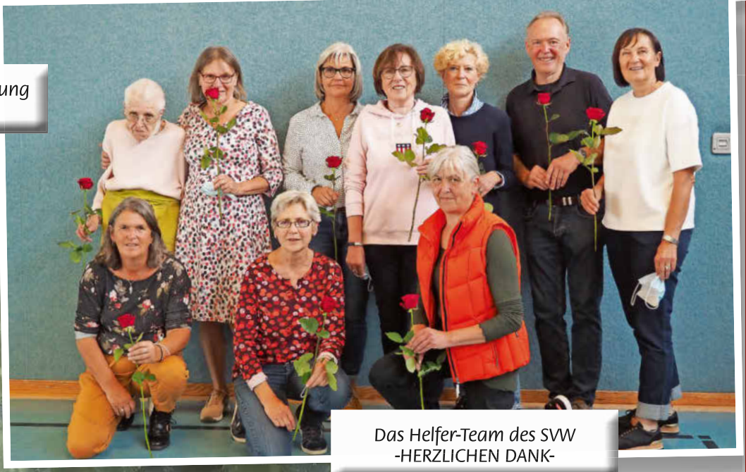
Das Helfer-Team des SWW -HERZLICHEN DANK-