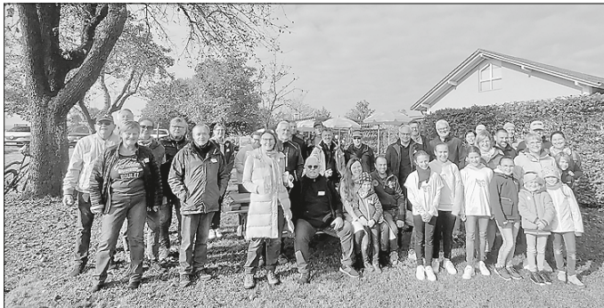
Die Teilnehmer des kleinen Herbstturniers 2021

Am Sonntag, 22.05.2022 ist es wieder so weit! Nach Corona-Pause und kleinem Herbstturnier 2021 starten wir mit dem regelmäßigen jährlichen Boule-Frühjahrsturnier durch. Anmeldungen ab sofort und bis spätestens 14.05.2022 an die E-Mail-Adresse: r.stadelmaier@stadelmaier-steuer.de Für Bewirtung ist bestens gesorgt. Beginn ist um 11.00 Uhr. Eine Mannschaft besteht aus 3 Personen. Bitte die Mannschaft mit Namen und Alter der Teilnehmer anmelden. Jede Mannschaft kann sich einen Fantasienamen geben. Altersbeschränkung von 0 bis 99 Jahre! Die jüngste und die älteste Mannschaft erhalten einen Preis sowie die ersten drei Sieger.