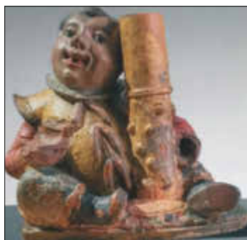
Zwei Arbeiten von Leonhard Kern aus dem Hällisch-Fränkischen Museum in Schwäbisch Hall: Der sogenannte „Tullauer Narr“, eine Brunnenfigur, und ein nacktes Mädchen mit Nachtopf.