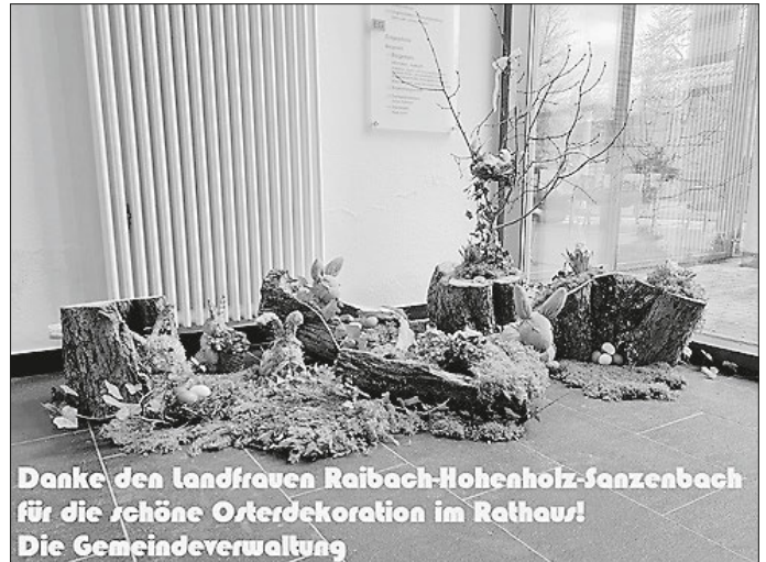
Danke den Landfrauen Raibach-Hohenholz-Sanzenbach für die schöne Osterdekoration im Rathaus! Die Gemeindeverwaltung